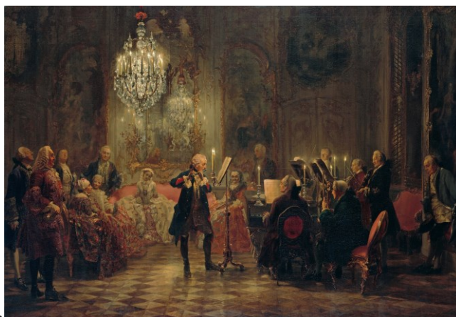
サンズシ宮のフルートコンサート(メンツェル画 1852)

プロイセン王国の英雄フリードリヒ大王は、フラウト・トラヴェルソ（バロックフルート）の名手でもありました。ベルリンの優雅な宮廷音楽をお楽しみ下さい。